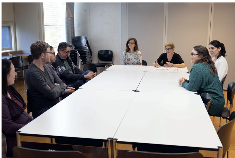
Signature de la convention, © N. Wenger, ACV

Le 2 juin 2023, l'assemblée générale de l'AVA acceptait la reprise par les Archives cantonales vaudoises (ACV) de la Plateforme des inventaires communaux Vaud archives communales et donnait le mandat au comité d'en régler les conditions. Les travaux ont abouti début 2024 et prennent la forme d'une convention signée le 3 mai 2024 par le Comité de l'AVA et les ACV. C'est une étape à marquer d'une pierre blanche dans l'histoire multiséculaire des inventaires communaux vaudois.